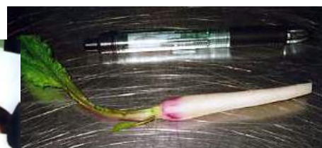
日本料理(つまもの)使用例 (根長8cmに整形)