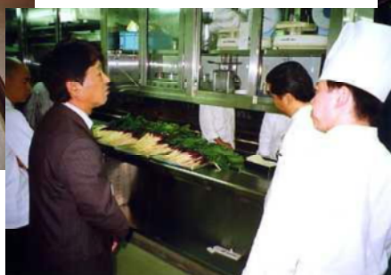
サンプルの間引き日野菜を前に 商談をすすめる役場農林課長 (大津プリンスホテルB1厨房にて)