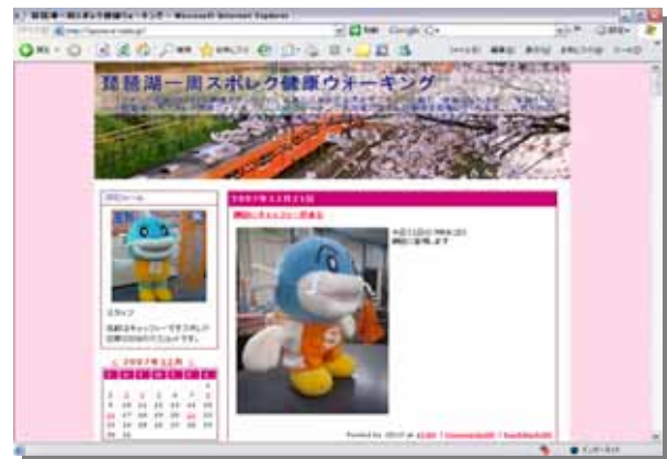
スポレク健康ウォーキングブログ