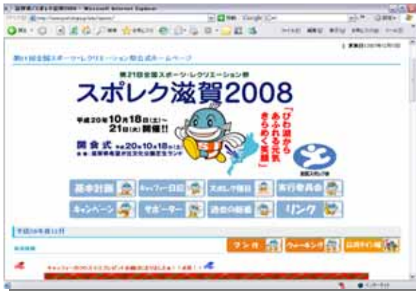
「スポレク滋賀2008」公式ウェブサイト