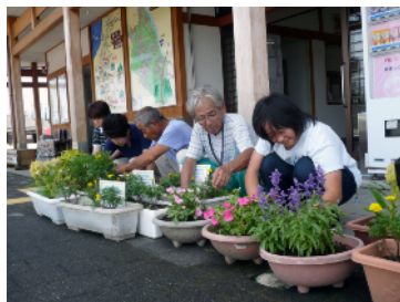
地域公共機関へ花を贈呈する活動