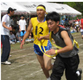
運動会 全力で走りきれ！