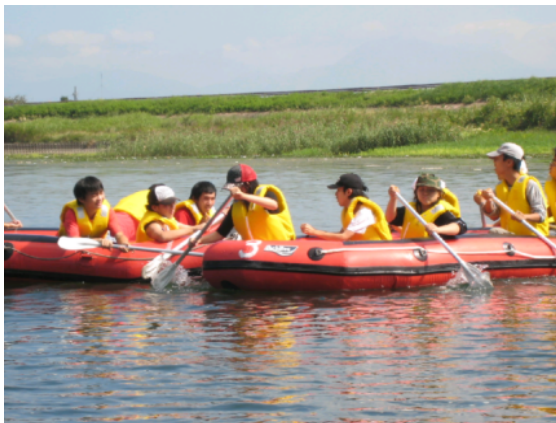
キャンプでの リバーポート体験