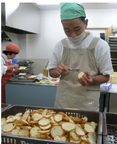
職場実習 自分にあった仕事をさがそう