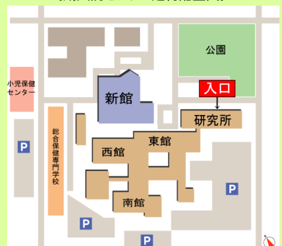
【成人病センター建物配置図】

※新型インフルエンザの感染拡大を防止するため、病み上がりの方、体調不良や発熱などの症状がある方は、参加をご遠慮ください。