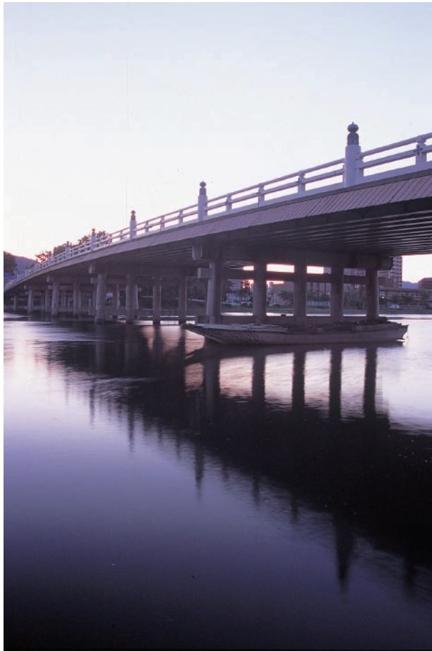
写真T3-1-1 現在の瀬田唐橋

瀬田唐橋は勢多大橋、長橋とも称された、瀬田川の渡河地点に架けられた日本史上最も著名な橋である。壬申の乱(672年)の舞台として『日本書紀』に、764(天平宝字8)年の恵美押勝の乱に関連し『続日本紀』に表れるほか、数々の記録に登場する。特に平安時代以降は東海・東山両官道の通る橋として、日本最要の橋として、重要視されてきた。