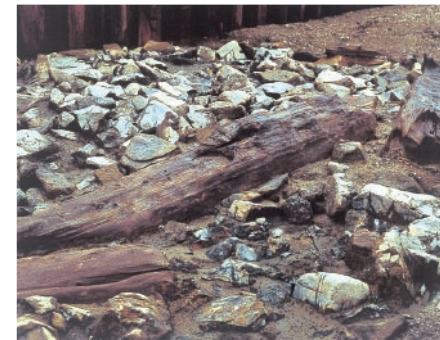
写真T3-1-2 唐橋 第1橋台